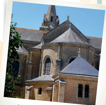
Église Saint Pierre de Tigné